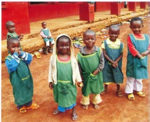
Diecezja Doumé Abong-Mbang w Kamerunie